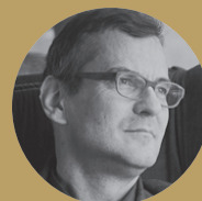
Jürg Graser Architecte Zurich/Winterthur