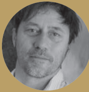
Marco Bakker Architekt Lausanne/Zürich