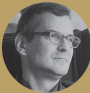
Jürg Graser Architekt Zürich/Winterthur